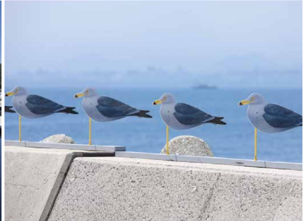
Takahito Kimura "Sea Gulls Parking Lot"