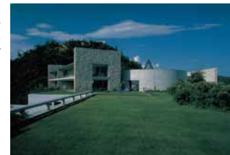
Benesse House