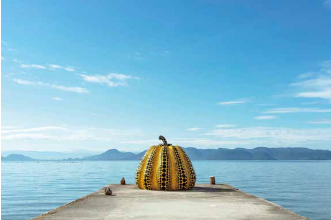
「南瓜」草間彌生 2022年 ©YAYOI KUSAMA