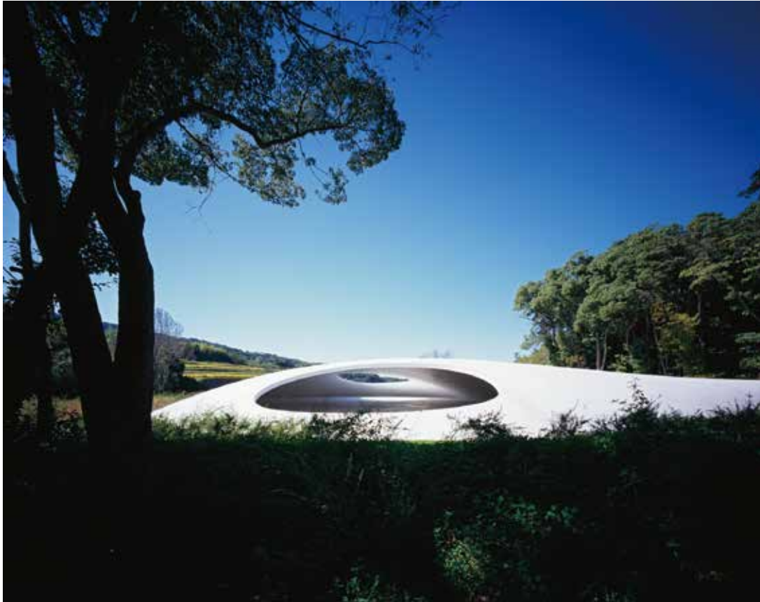
Teshima Art Museum