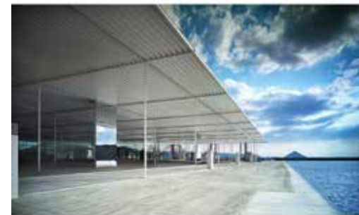
KAZUYO SEJIMA + RYUJI NISHIZAWA / SANAA " Marine Station "Naoshima"