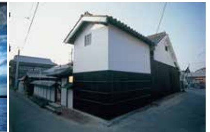
Art House Project "Kadoya"