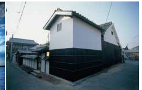
Art House Project "Kadoya"