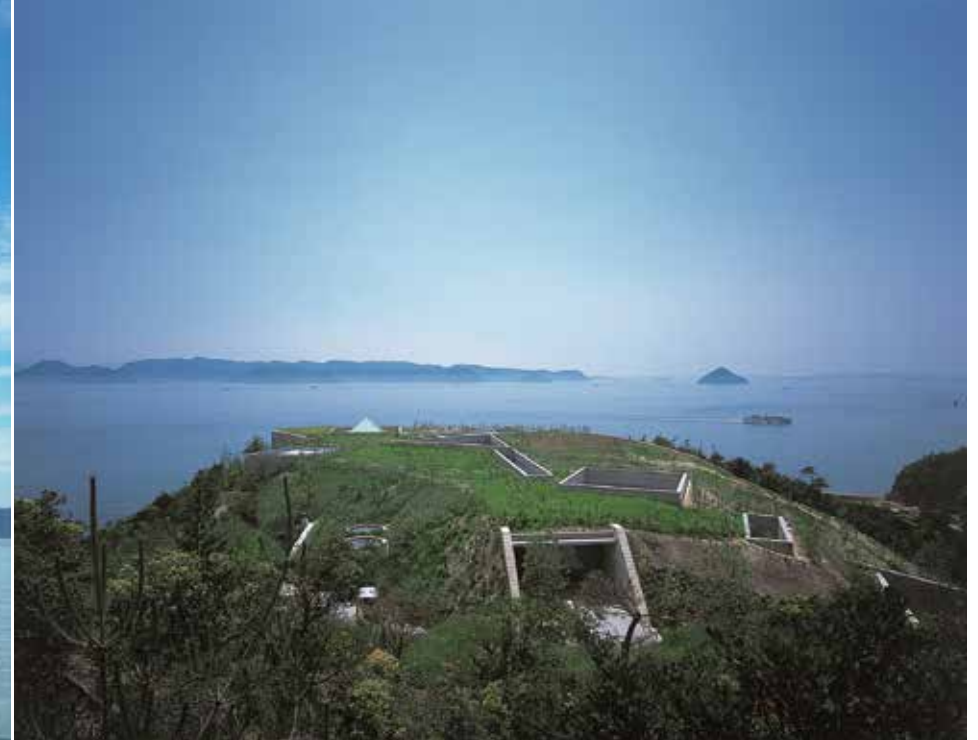
Chichu Art Museum