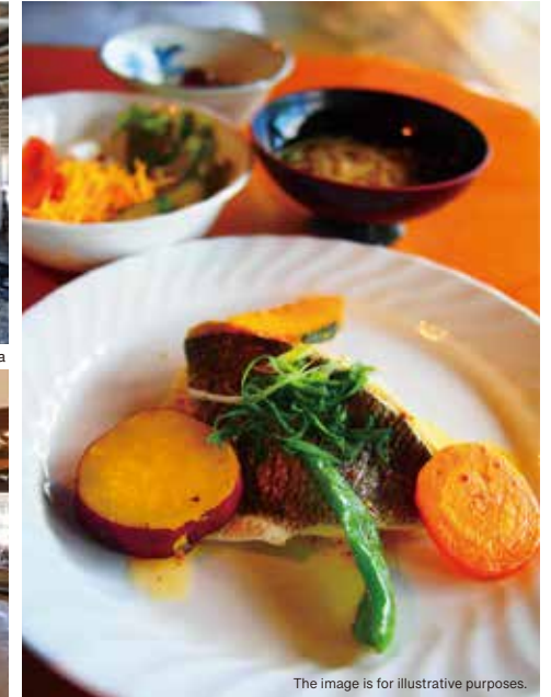
The image is for illustrative purposes.