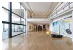
Benesse House Museum

A "stay at a museum" hotel where you can enjoy nature and art to your heart's content. All of the architecture was designed by Tadao Ando, one of Japan's leading architects. The hotel also offers an appreciation menu exclusively for guests, so you can immerse yourself in art 24 hours a day.