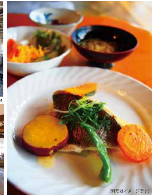
(料理はイメージです)