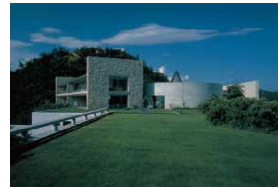
Benesse House