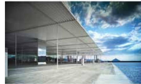
KAZUYO SEJIMA + RYUE NISHIZAWA / SANAA Marine Station "Naoshima"