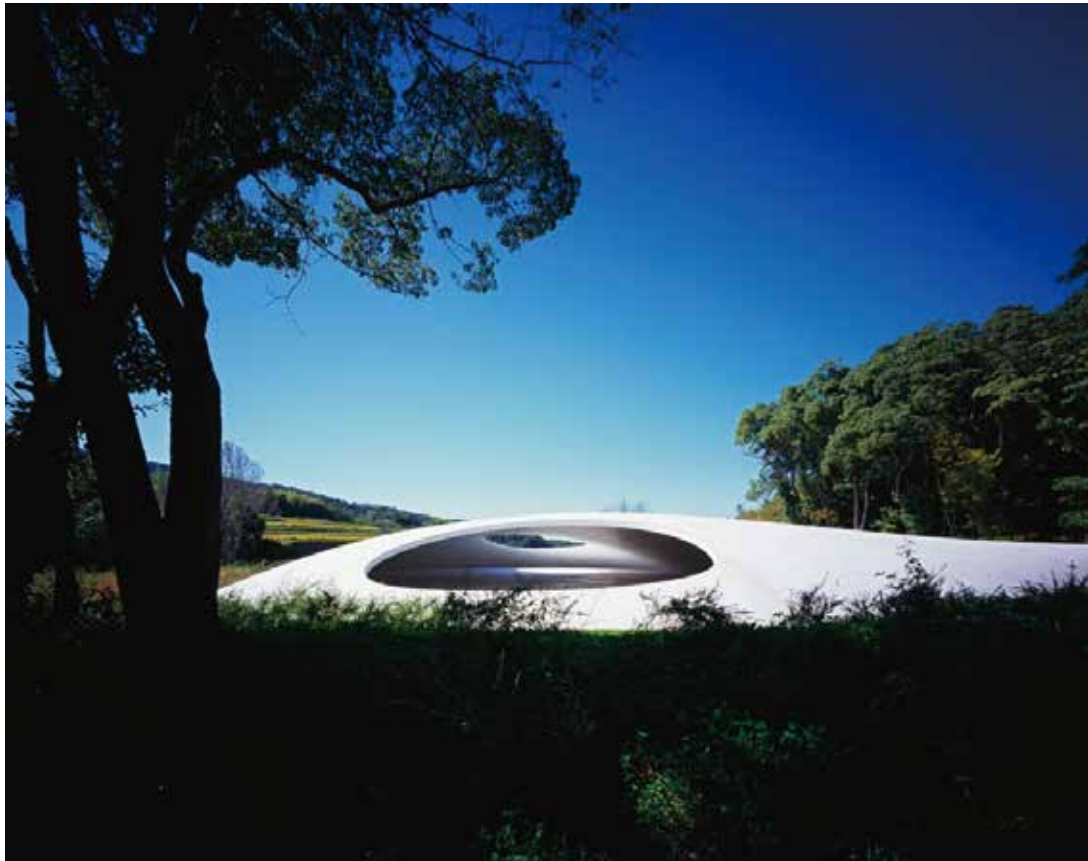
Teshima Art Museum