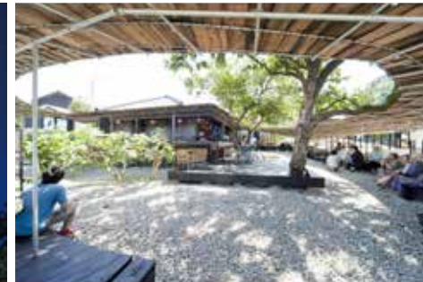
Shima Kitchen