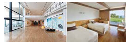
Benesse House Museum

自然とアートを心ゆくまで楽しめる「美術館に泊まれる」ホテルです。建築はすべて安藤忠雄の設計、宿泊者限定の鑑賞メニューもあり、24時間アートに浸りながら過ごすことができます。