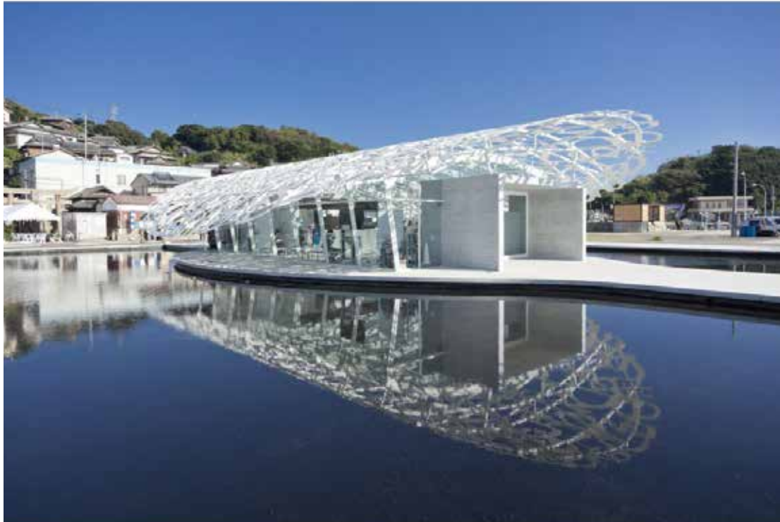
Jaume Plensa "Ogijima's Soul"