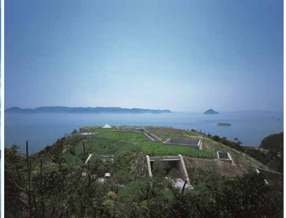
Chichu Art Museum